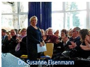
Dr. Susanne Eisenmann

Die BW-Ministerin für Kultus, Jugend und Sport, Dr. Susanne Eisenmann , sprach am 15. Januar beim Neujahrsempfang der CDU Mühlacker in der Musikschule Gutmann vielen aus dem Herzen und deutliche Worte zur Bildungspolitik. Ruhe und Verlässlichkeit werde gebraucht: „ständige Strukturdiskussionen und Reformansätze bringen Unruhe ins System“.