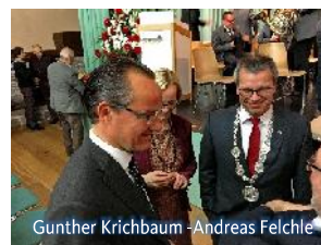
Gunther Krichbaum -Andreas Felchle

Es sollte sich im Laufe des Jahres herausstellen, dass Getöse und markige Worte aus dem Munde des Mannes aus Würselen politisch ihm nicht zur „Machtergreifung“ halfen. Unser CDU Bundestagsabgeordneter Gunther Krichbaum war jedenfalls am 6. Januar 2017 einer der ersten Gäste beim Neujahrsempfang der Stadt Maulbronn in der Stadthalle.