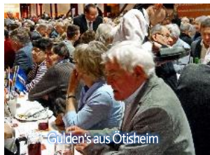
Gulden's aus Ötisheim