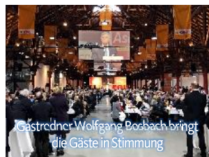
Gastredner Wolfgang Bosbach bringt die Gäste in Stimmung

Am 1. März lud der CDU-Kreisverband Enzkreis/Pforzheim wieder zum Politischen Aschermittwoch in die „Alte Kelter“ nach Fellbach ein.