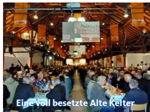
Eine voll besetzte Alte Kelter