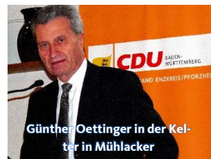
Günther Oettinger in der Kelter in Mühlacker

Bereits ein Tag danach war der ehemalige Ministerpräsident von Baden-Württemberg Günther Oettinger in der Kelter in Mühlacker und sprach zum Thema: "Wirtschaft, Gesellschaft, Arbeitsmarkt und digitale Revolution – wie sichern wir die Zukunft Europas?" Oettinger hob - seinem neuen Amt entsprechend - die Vor- und Nachteile der digitaltechnischen Entwicklung und die Auswirkungen auf dem europäischen Arbeitsmarkt hervor.